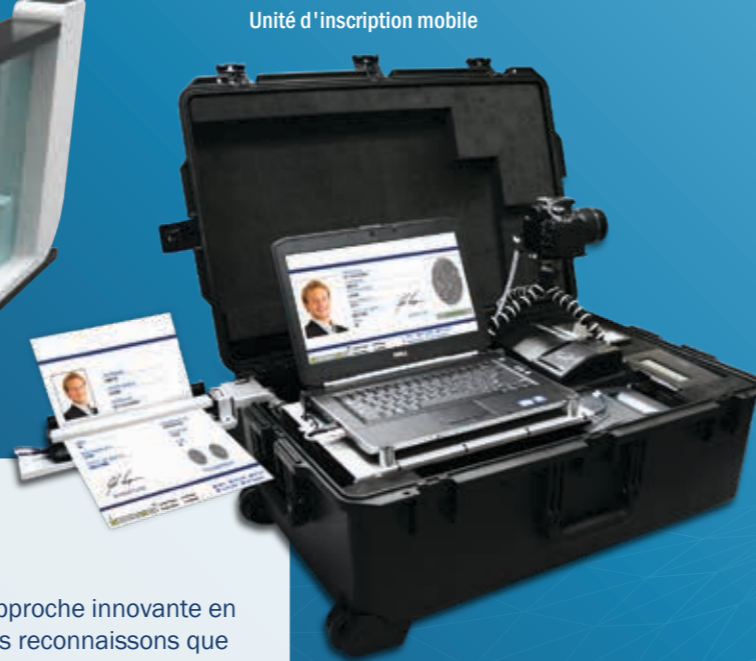
Unité d'inscription mobile