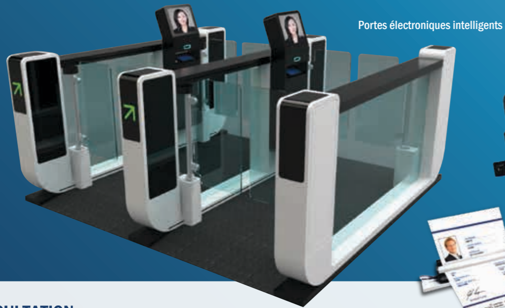
Portes électroniques intelligents