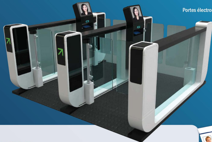
Portes électroniques intelligentes

APPAREILS À LA POINTE DE LA TECHNOLOGIE, ROBUSTES