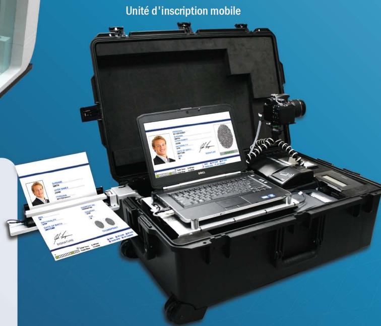
Unité d'inscription mobile